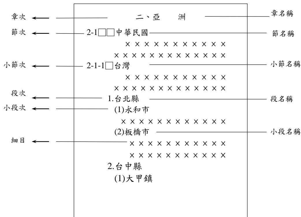
圖 4 章節、段落、文字層次範例

For paragraphs within paragraphs, indent different spaces at the beginning of each major and minor paragraph in order to state the order clearly.